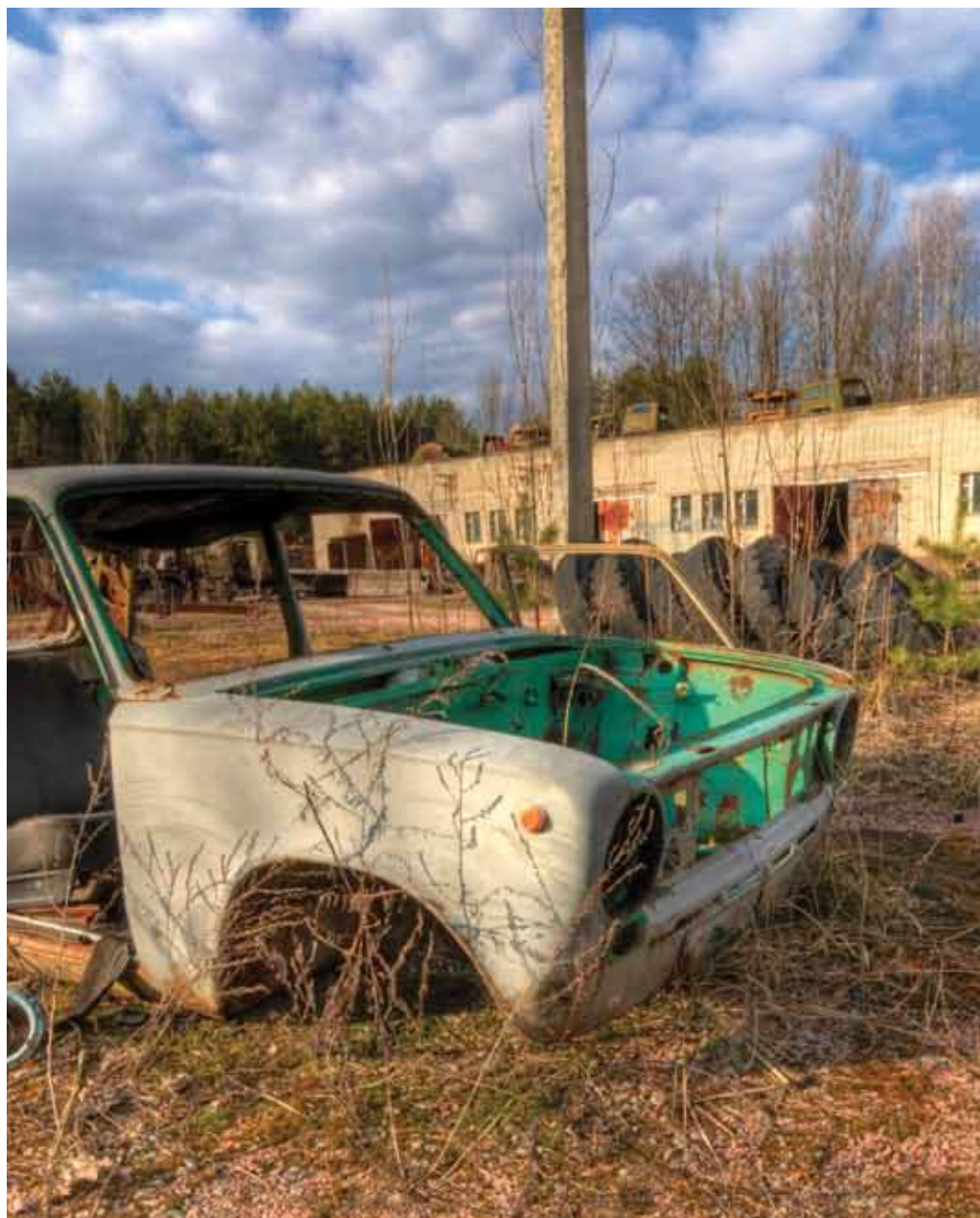
سيارة أمام موقع كتائب: حطام سيارة في محطة كتائب قديمة في بريبات