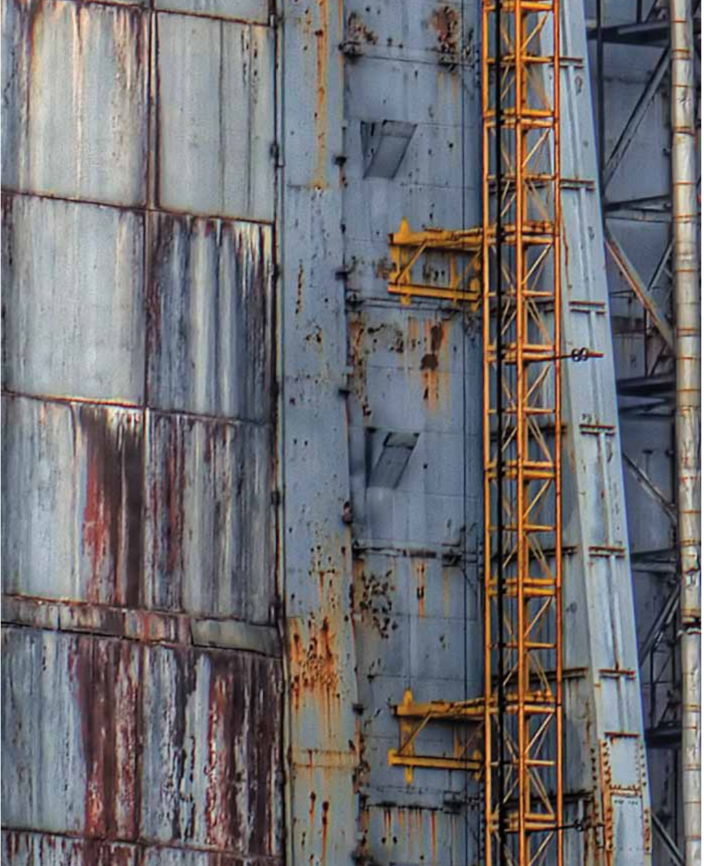
توابيت تشرنوبل بتفاصيل 07. تفاصيل التوابيت الإسمنتية التي شيدت حول مفاعل تشرنوبل المنكوب رقم 4