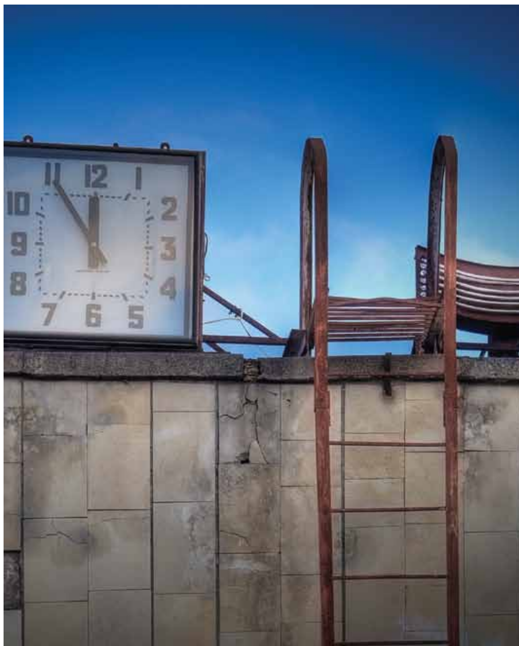
ساعة حوض السباحة، ساعة على حوض السباحة العام في بريبات