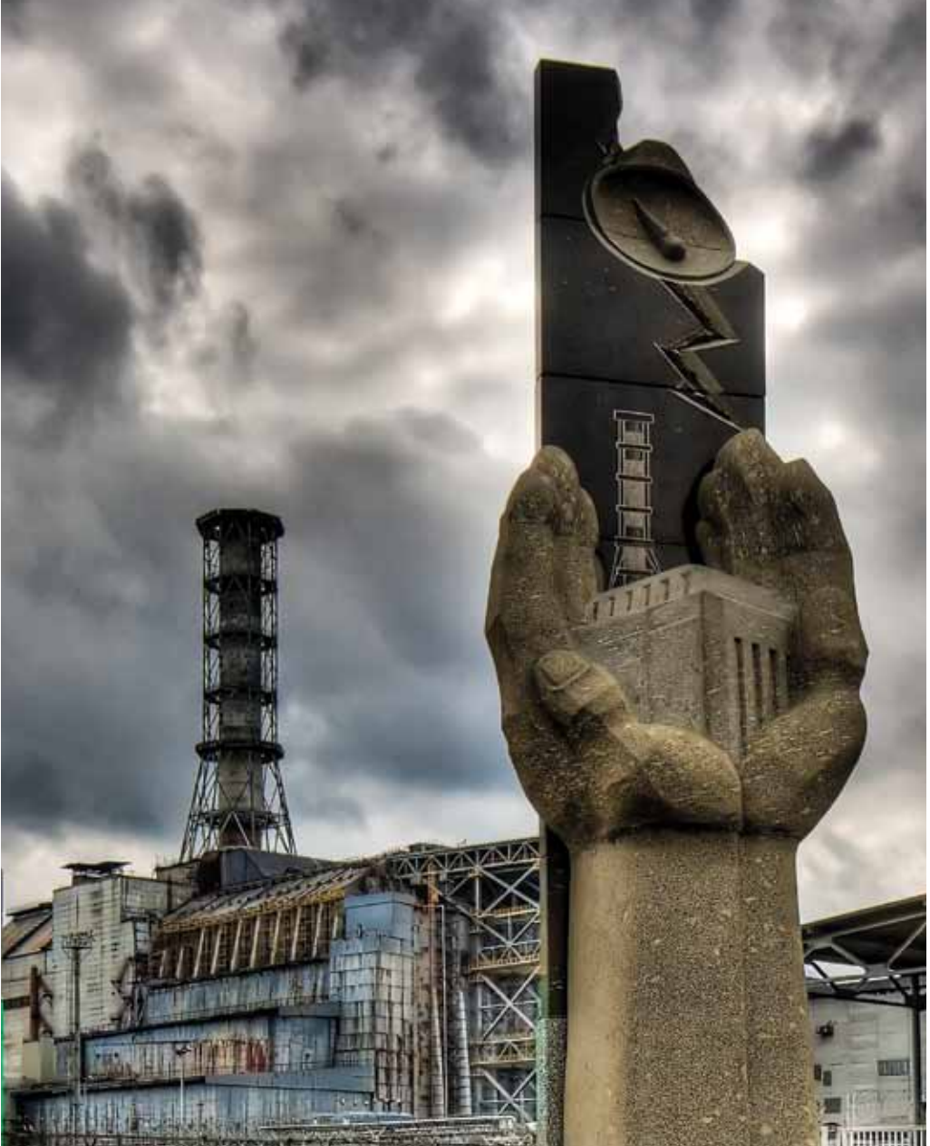
نصب تذكاري للمفاعل تشرنوبل 02: نصب تشرنوبل التذكاري وبرج التبريد للمفاعل المنكوب # 4 في خلفية المشهد