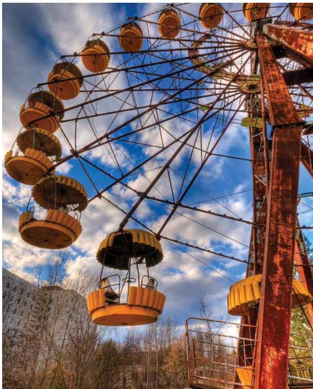
مسار السكة الحديد 05. مدينة ملاهي في برييات