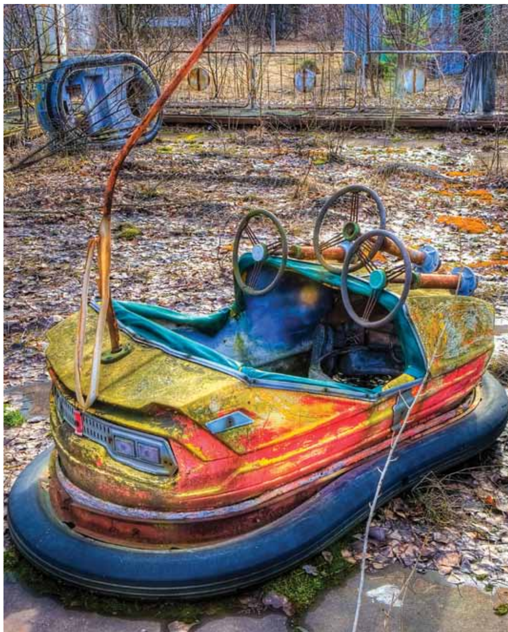
سيارات الضحك. مدينة الملاهي في برييات