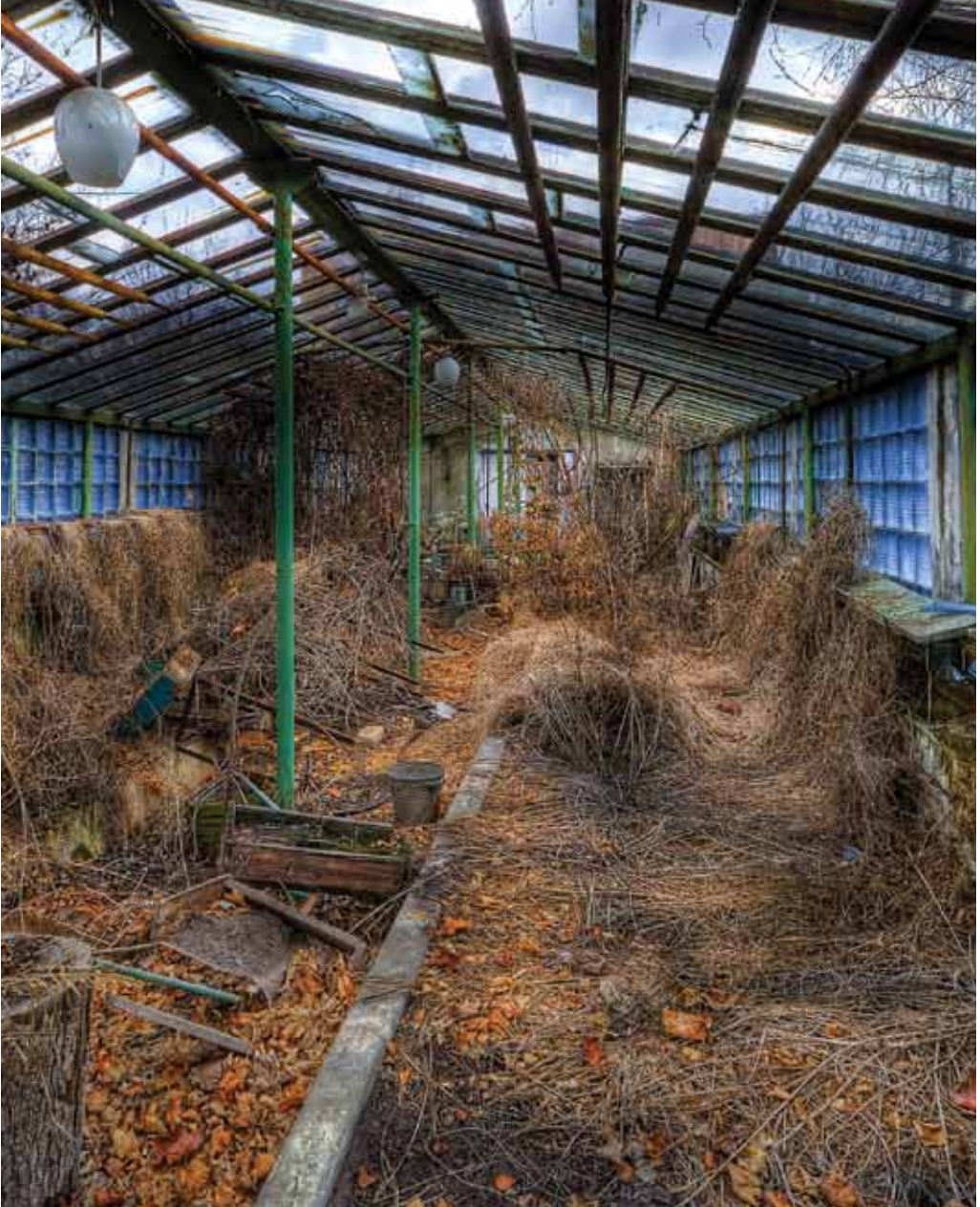
حمام زراعي في مدرسة 06: حمام زراعي في مدرسة في بربيات